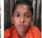
মামাতো ভাই Māmātōbhā'i